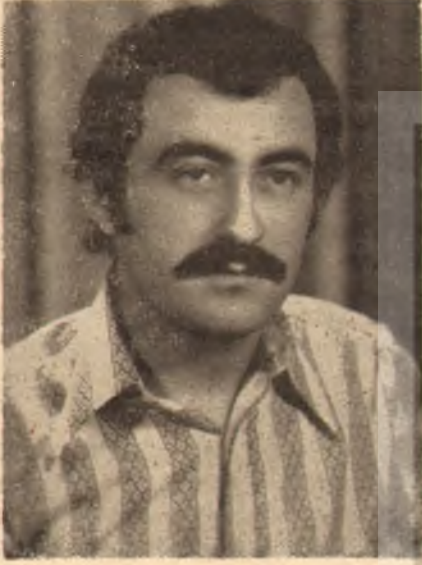
ALİ BAYIK (1952 — .....)